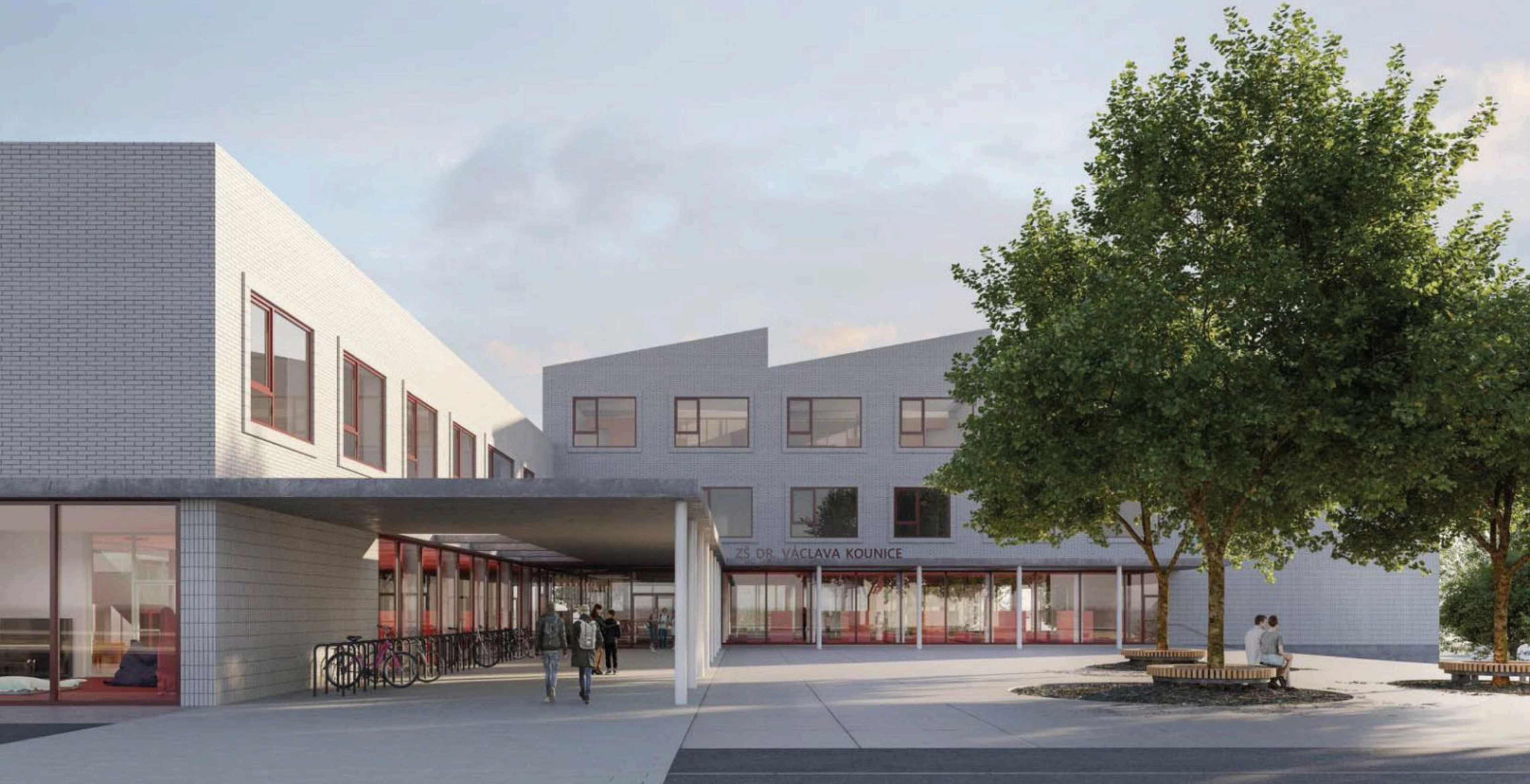
Vítězný návrh architektonické soutěže z roku 2021, Atelier 99 & UYO architekti.